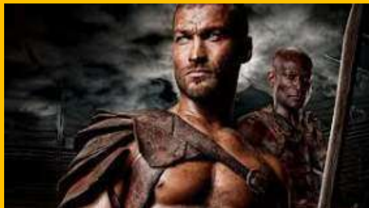
SPARTAK – ČUVENI GLADIJATOR, BIO JE PO LEGENDI TRAČANIN - SRBIN

Iliri, Tračani, Dačani i dr. samo su različita imena za Srbe. Takozvane seobe Slovena u VII veku na Balkan nije bilo, svi Slovenski narodi nastali su od Srba. Srpski jezik je osnova za sve evropske jezike a starosrpsko pismo – SRBICA je najstarije pismo iz koga proističu sva ostala pisma. U XV veku Papa Pije II je pisao: Tribali, Geti, Tračani, Iliri, Dačani – sve su to u stvari Srbi “