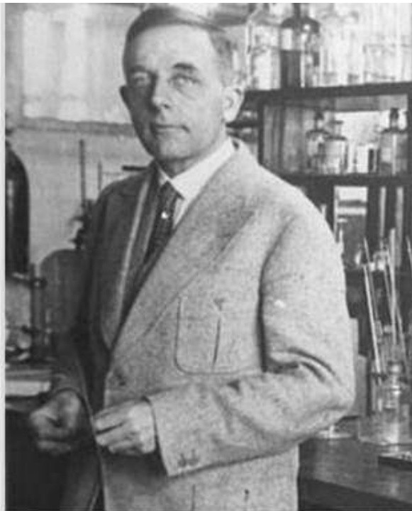
Nobelovac Otto Heinrich Warburg (1883.-1970.)

Dr. Warburg je otkrio da kancerogene ćelije nastaju usled fizičke neaktivnosti (odnosno slabe prokrvljenosti organizma i nedostatka kiseonika u ćelijama) i uzimanja hrane koja izaziva kiselost; "Tumorske ćelije su kisele i ne troše kiseonik, tako da je rak u stvari odgovor imunog sistema na ovakve uslove" – rekao je Warburg!