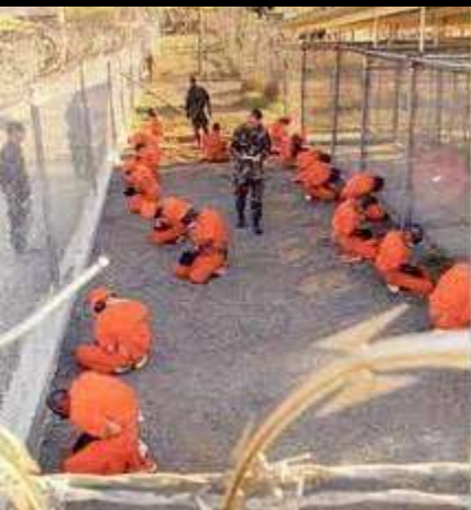
NACISTI IZ GVANTANAMA