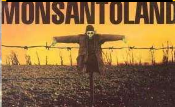
JEDEMO OTROVNU HRANU