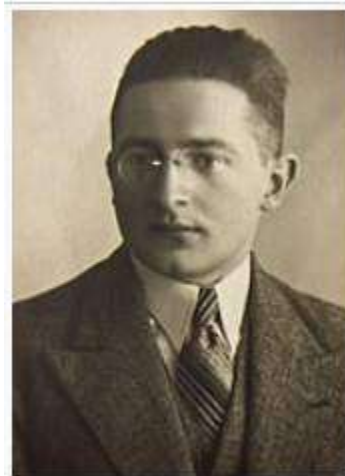
Маријан Рејевски (1932)