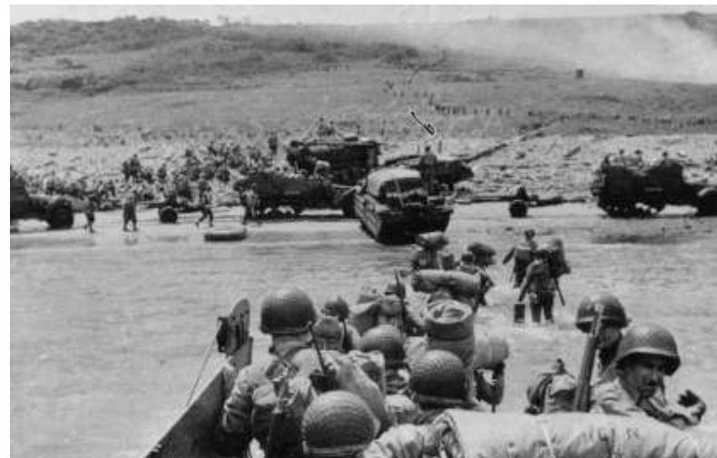
Normandija, iskrcavanje; Saveznici znali sve detalje Nemačke odbrane. .

Razbijanje nacističkih šifara je prelomni događaj i jedna od najvećih tajni II sv. rata; Da nije bilo ova tri velika čoveka, ko može pouzdano reći kako bi se istorija dalje odvijala ? (Priča o Džonu Kernkrosu je nešto posebno..)