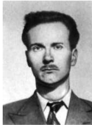
British traitor John Cairncross

Za britance je on “izdajnik”.. Iako je pomogao presudno da se pobedi nacizam ! Isti ti englezi su uštrojili Tjuringa koji je “spasao Veliku Britaniju” – što se tvrdi i u filmu.. Toliko o zapadu i vladarima iz senke, setite se toga kad slušate o “Ukrajinskoj krizi” danas, 2014 godine !