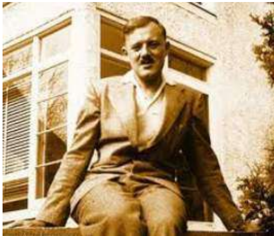
Bill Tutte, čovek koji je, možda, prelomio tok cele ljudske istorije