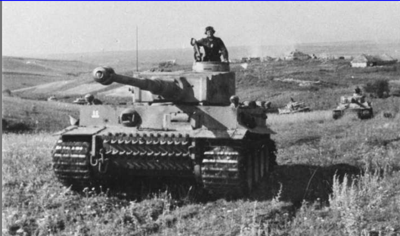
Bundesarchiv, Bild 10 1111-Zschaeckel-207-12 Foto: Zschäckel, Friedrich | Juni 1943