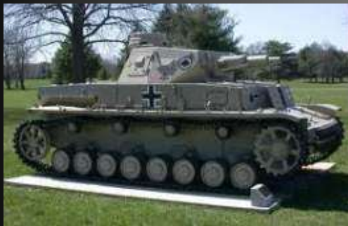
Čuveni “panzer VI Tiger” Nemački Tenk

Amerikanci su, ne znali – već pomagali Hitleru da se naoruža !